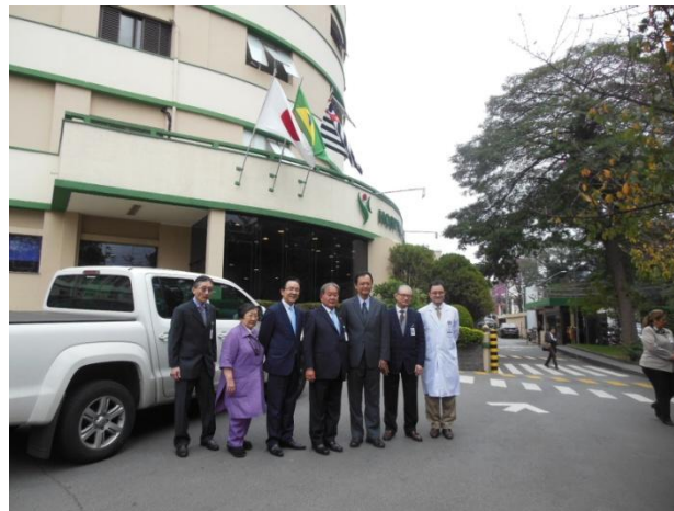
Participantes da Cerimônia