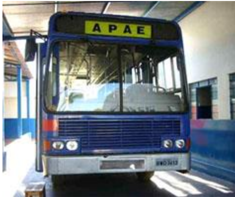
Ônibus ano 92 de propriedade da APAE

Detalhes da Doação: ônibus com elevador para cadeiras de rodas