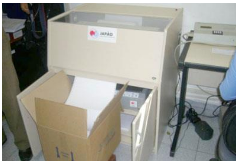
Aparelho doado para transcrição braille que produz livros em pequena escala