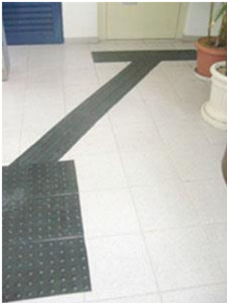
Piso direcional e de alerta ante o elevador

Nacional Brasileiro, o que demonstra exatamente a meta da nossa instituição, que é a “INTEGRAÇÃO”. Com a doação dos equipamentos para transcrição braille, poderemos publicar pequenas quantidades de livros vários temas, aumentando o leque de opções na educação do deficiente visual. Como representante da instituição, quero demonstrar meu profundo agradecimento ao povo e ao governo japonês.”