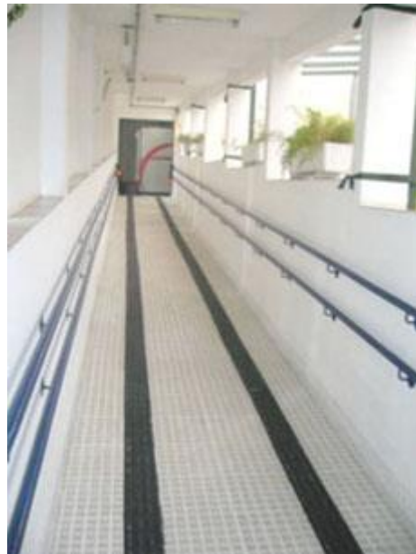
Detalhes pós-reforma (corrimão e piso direcional)