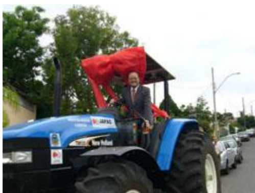
Representantes da APAE de Tangará da Serra

Linhas Gerais do Projeto: Desde 1995, a Prefeitura de Clementina vem desenvolvendo um programa de geração de renda na área agrícola para famílias de agricultores de baixa renda fornecendo-lhe lotes de terra, orientação técnica e sementes. Devido ao aumento da demanda, era necessário adquirir um trator, bem como aumentar o número de canos. Para a presente cooperação foram destinados R$ 153.748,00 para aquisição de trator e canos.